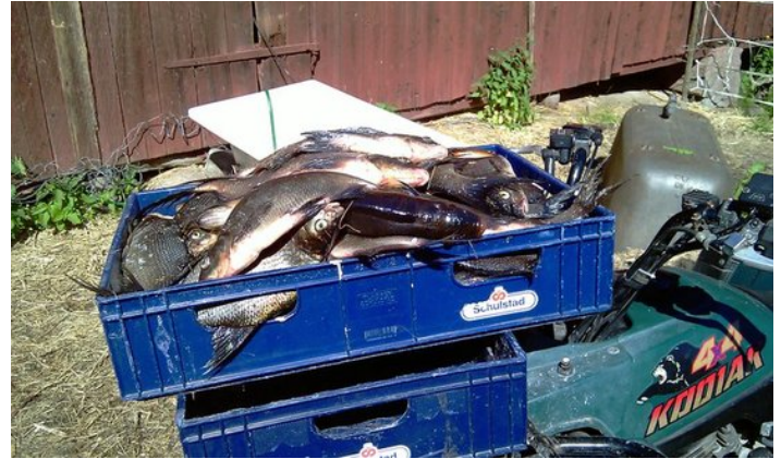
Nätfiskad braxen. Underbar matfisk och perfekt kräftbete.

För den som vill fiska för att komplettera matförrådet i hushållet så kan fiske med nät vara en bra metod men som med allt annat fiske krävs det dels att man har tillstånd att fiska och dels att man känner till sitt fiskevatten.