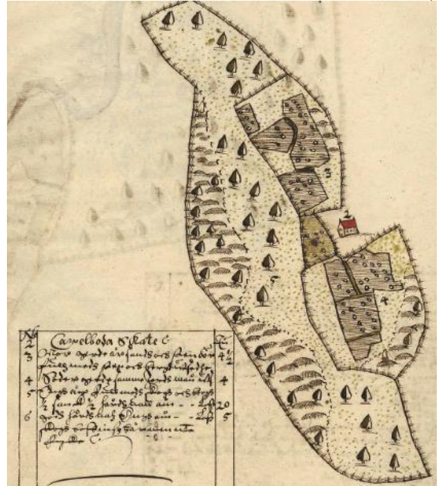
Byn Kalbo i Östergötland år 1650

Att kunna hitta äldre information om sin fastighet kan både vara till nytta samtidigt som det är otroligt spännande och intressant. I de gamla dokumenten kan man eventuellt se hur länge gränser har existerat och få de historiska gränsmarkeringarna beskrivna, vilka allmänningar/gemensamhetsanläggningar som fastigheten har rätt att utnyttja, hitta gamla igenplanterade åkerstycken som kan vara värt att bryta upp igen, se servitutshandlingar om man är osäker på exempelvis hur/om man har rätt att utnyttja en väg o.s.v.. Eller via gamla fotografier hitta hur fastigheten såg ut för 100 år sedan om man gärna vill ha tillbaka det "ursprungliga" utseendet på sitt hus. Sist men inte minst är det dessutom otroligt spännande att se vilka personer som trampat på markerna innan en själv, det ger ett perspektiv till sina egna handlingar på fastigheten.