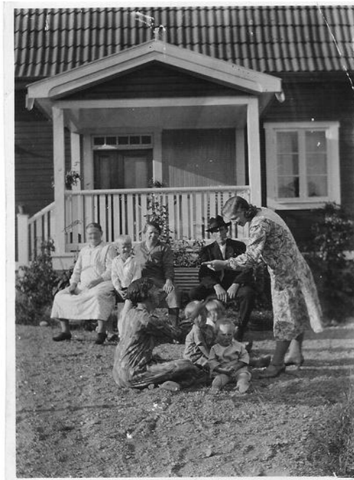
Gammalt släktfoto med detaljer av fastigheten i bakgrunden.

Här följer några tips på hur man kan lokalisera gamla fotografier av sin fastighet.